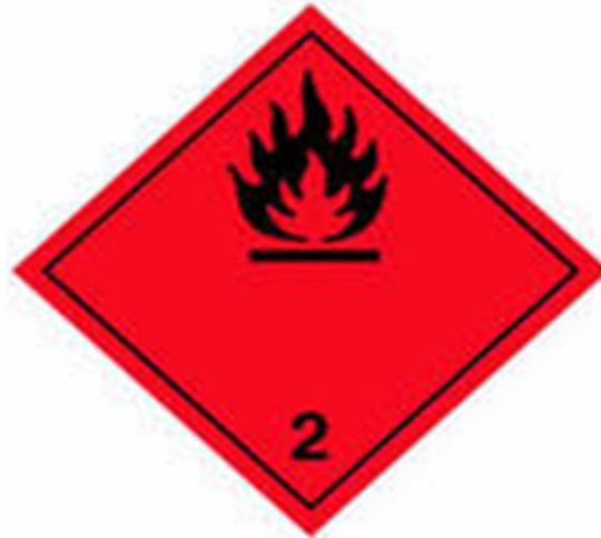
Рисунок 4 – Знак «Опасный груз» с кодом опасности 2

На транспортных средствах, перевозящих опасные грузы, устанавливается опознавательный знак «Опасный груз» (Рис. 4).