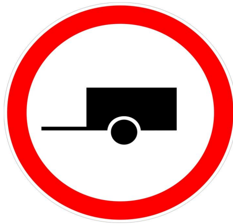
Рисунок 3 – Знак «Движение с прицепом запрещено»

1. Знак «движение с прицепом запрещено» запрещает буксировку механических транспортных средств. В данном случае запрещается движение грузовых автомобилей и тракторов с прицепами любого типа, а также буксировка механических транспортных средств.