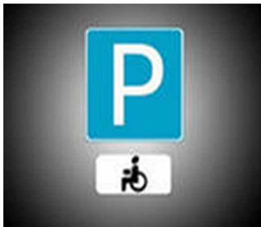
Рисунок 1 – Знак «Место парковки для инвалидов»

Эти места не должны занимать другие транспортные средства. В ряде случаев (у торгово-развлекательных центров, у административных зданий), особенно около предприятий, где работают инвалиды, создаются стоянки для парковки исключительно мотоколясок и автомобилей, на которых установлены опознавательные знаки «Инвалид». Такие стоянки обозначаются специальными знаками (Рис. 1) и дорожной разметкой (Рис. 2).