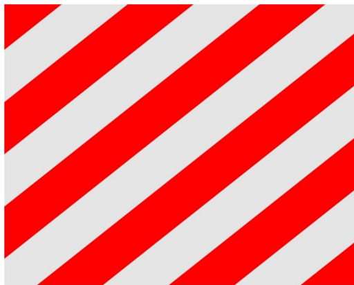
Рисунок 5 – Знак «Крупногабаритный груз»

Движение транспортного средства, габаритные размеры которого с грузом или без груза превышают по высоте 4,0 м, по ширине 2,5 м, по длине, включая один прицеп, 20 м, либо с грузом, выступающим назад более чем на 2 м, рассматривается как перевозка крупногабаритного груза.