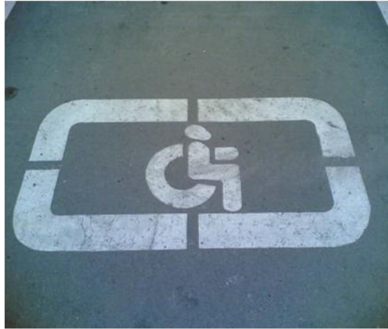
Рисунок 2 – Дорожная разметка, обозначающая место парковки инвалидов

Нарушение правил остановки или стоянки транспортных средств в местах, отведенных для остановки или стоянки транспортных средств инвалидов, – влечет наложение административного штрафа на водителя в размере от трех тысяч до пяти тысяч рублей 16 .