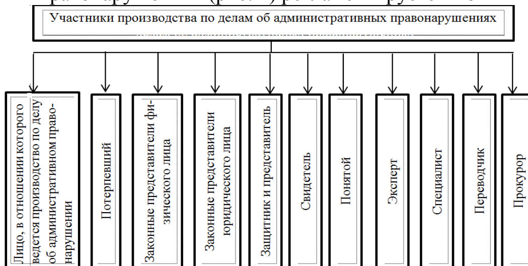
Рисунок 1 – Участники производства по делам об административных правонарушениях

Состав участников производства по делам об административных правонарушениях (рис. 1) регламентируется КоАП РФ.