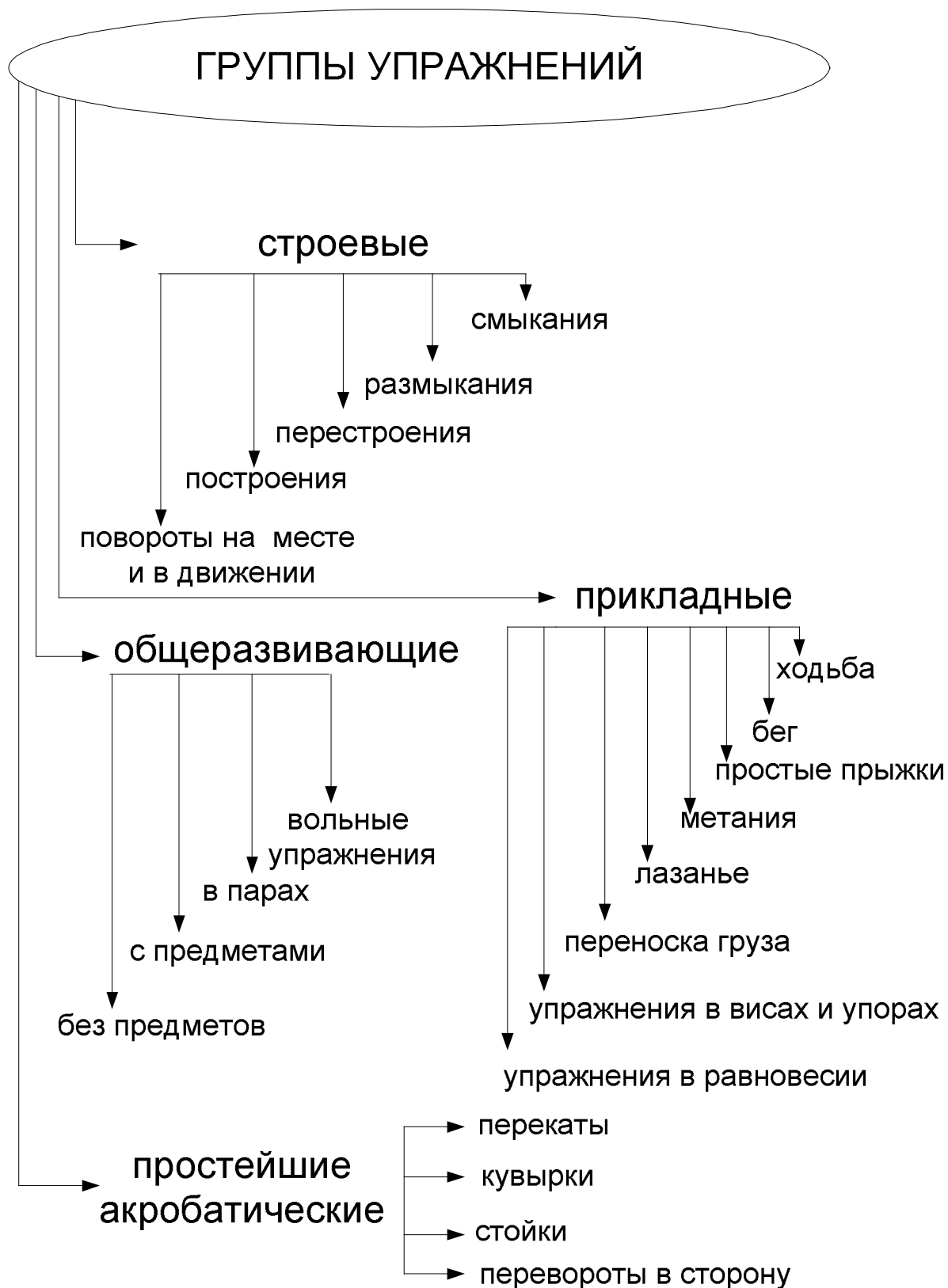
Рис. 2 Группы упражнений, составляющие содержание основной гимнастики