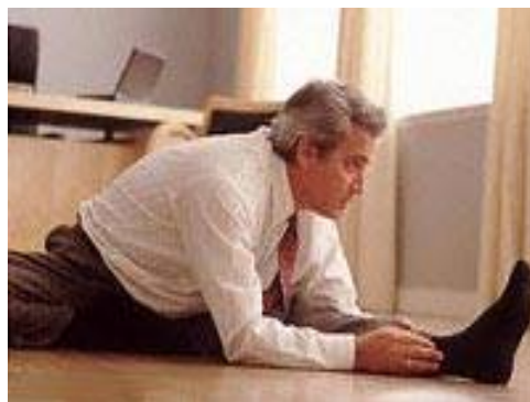
Рис. 7 Физкультпауза

Физкультпауза – основная форма проведения гигиенической гимнастики в режиме рабочего дня. Основная функциональная цель — отвлечься от основной деятельности, переключиться на иной ее характер, дать небольшой отдых нервной системе и группам мышц (или органам, например, глазам), подвергавшихся воздействию профессиональной нагрузки (Рис. 7).