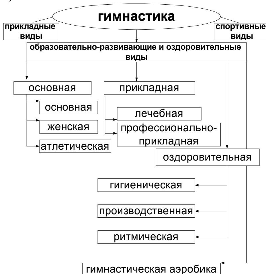
Рис. 1 Виды образовательно-развивающей и оздоровительной гимнастики

Несмотря на то, что широкое использование гимнастики обусловлено решением большого количества задач физического воспитания, отдельно взятые ее виды четко направлены на локальное решение вопросов и проблем, связанных с той или иной стороной физического воспитания как педагогического взаимодействия с различным контингентом. Основные виды образовательно-развивающей и оздоровительной гимнастики могут быть использованы и в повседневном быту человека, и в воспитательно-образовательном процессе, а также как средства релаксации, постреабилитационного периода после болезни и т. д. (Рис. 1).