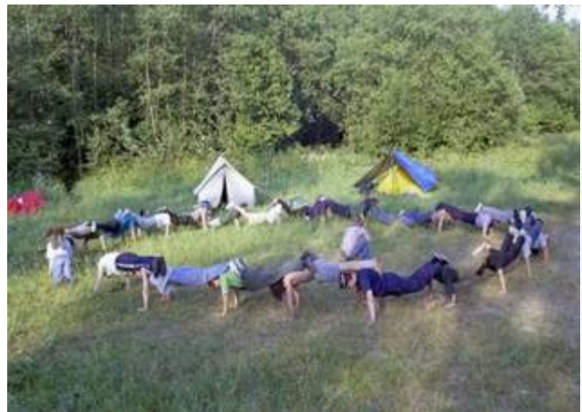
Рис. 5 Утренняя зарядка

Утренняя гимнастика. Используется в период перехода от пассивного состояния (сна) к активной деятельности (Рис. 6). Во время сна, когда основные функциональные системы находятся в состоянии минимального возбуждения (или заторможены) и в силу их инертности, переход от физиологического покоя к бодрому состоянию должен протекать, с одной стороны, спокойно, но, с другой –