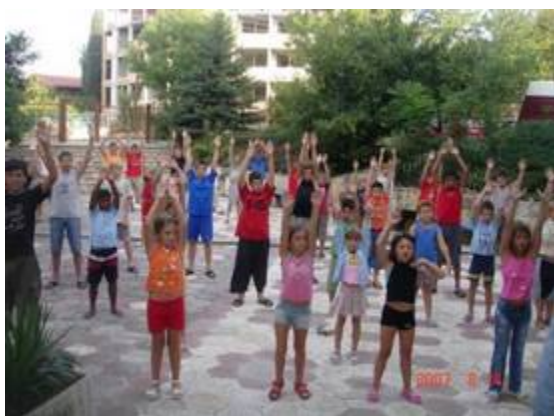
Рис. 5 Гигиеническая гимнастика

Гигиеническая гимнастика. Это система простейших упражнений, направленная на обеспечение оптимального текущего состояния организма человека. Может применяться практически во всех возрастных периодах и при любой подготовленности к физической нагрузке (Рис. 5).