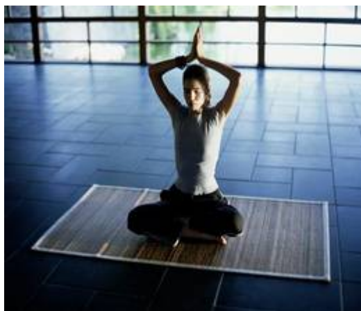
Рис. 8 Вечерняя гимнастика

При определении содержания упражнений весьма важно учитывать типологические особенности высшей нервной деятельности.